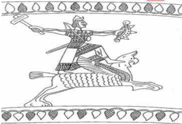
وینە ی ژماره ٧: خواوەند ئوا (Belli 1998, 57)