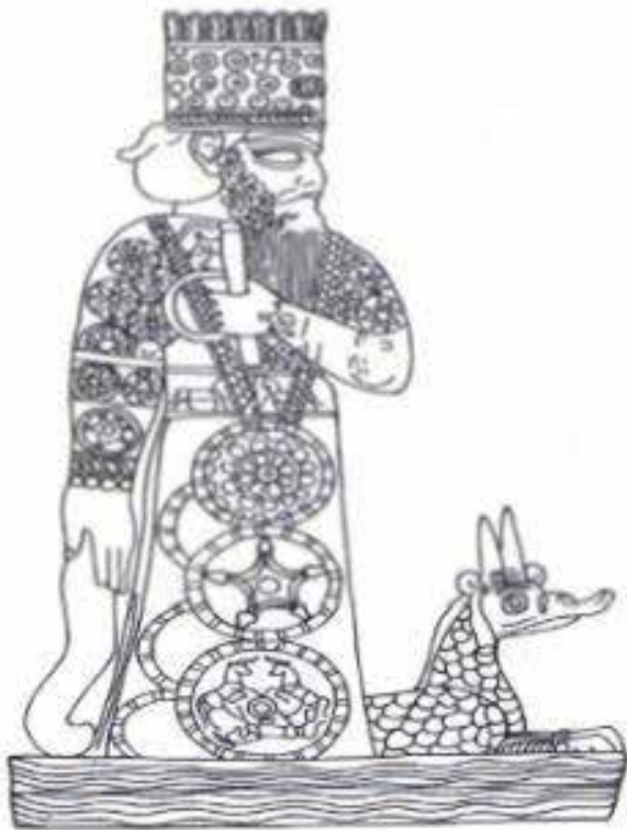
وینیه ژماره ١٢: خواوه نده مه ردۆخ (Oates 2004: Resim 121)

به لام ده بیژیت له ته نیشته ئه م سى خواوه نده که ئیمه له نووسراوه کانی ئورارتیه وه بهرچاومان ده که ویت، خودای چوارهم به ناوی مه ردۆخیش زیاد کراوه. باسکردنی ناوی مه ردۆخ له پانتیۆنی ئورارتوی دووه مدا. ده توانییت وهک ره نگدانه وهی ئه و په یوه ندیه گه مانه ی که له گه ل ئاشووردا په ره ی سه ندوو له سه رده می رووسادا هه ژمار بکریت (Çilingiroğlu-Salvini 2001: 20). به لام پاشا روسای دووه م خه لکی له ئاشووره وه هیناوه ته سه ر خا که کانی ئورارتو (Kirschbaum 2004: 138). ره نگدانه وهی ناوی مه ردۆخ له سه ر نووسراوه کان ده توانییت په یوه ست بکریت به گه لی ئاشووریشه وه که له خا که کانی ئورارتو ده ستیان به ژیان کردوووه.