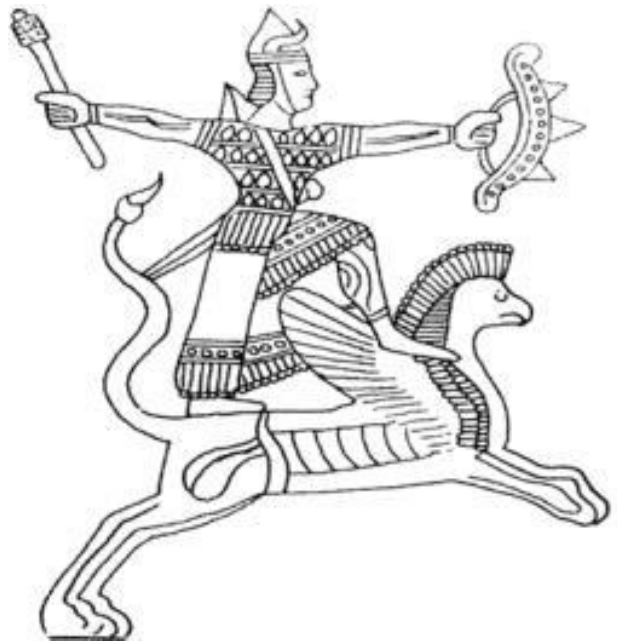
وینه‌ی ژماره‌ ٩: خواوه‌ند ئیرموسینی

له‌ قه‌لای چاوشته‌په‌ دوو په‌رستگا هه‌ن، که‌ سه‌ردوری دووه‌م دروستی کردوو، یه‌کێکیان بۆ خودا خالیدی و ئه‌وی دیکه‌یان بۆ خودا ئیرموسینی که‌ له‌ ریزی ١٩ لیستی خواوه‌نده‌کانی ده‌رگای میه‌ردایه‌ (Çilingiroğlu 1997: 67). په‌رستگای ئیرموسینی ده‌که‌ویته‌ قه‌لای خواره‌وه‌. بۆ خودایه‌ک که‌ بتوانیه‌ت شوینیکێ زۆر نزم له‌ لیستی ده‌رگای میه‌ردا بدۆزیه‌وه‌، دووه‌م. جیگای سه‌رنجه‌ که‌ په‌رستگاگه‌ له‌لایه‌ن سه‌ردوریوه‌ دروست کراوه. خواوه‌ندی ئیرموسینی که‌ له‌ لیستی ده‌رگای میه‌ردا داوی لیکرابوو که‌ په‌شه‌ولاخیک و دوو مه‌ر بکاته‌ قوربانی، په‌نگه‌ هه‌ر خواوه‌ندی ریار بیه‌ت که‌ له‌ تۆماره‌کانی هیرشی پاشای ئاشوری هه‌شته‌می (سه‌رگۆنی دووه‌م ٧٠٥/٧٤١ پ.ز) دا ئاماژه‌ی پێ کراوه‌ (Çilingiroğlu 1997: 161). ریار یه‌کێکه‌ له‌و شارانه‌ی ده‌که‌ویته‌ نیوان ده‌ریاچه‌ی وان و باکووری خۆرئاوای ئیران (Çilingiroğlu 1994: 95-96). ئه‌م شاره‌ له‌ تۆماره‌کانی گه‌شتی هه‌شته‌می سه‌رگۆنیشدا ئاماژه‌ی پێ کراوه‌ ”... و من هاته‌ ریار، شاری ئیشتاردوری...” (LAR II: 165).