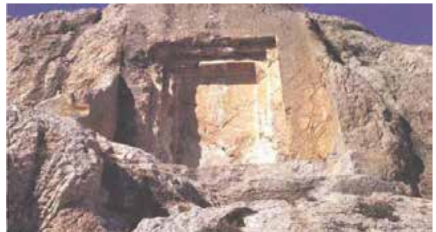
وینهى ژماره ١ : ده‌روازه‌ى ميه‌ر (Sevin 2003, 196).

له بنه‌ره‌تا ئايىنى ئۆرارتو ئايىنىكى فره‌خواوه‌نده، واته زياد له يه‌ك خواوه‌نديان هه‌بووه، سه‌ره‌پاي پاراستنى نه‌ريته كۆنه‌كانى خۆيان، به‌لام داھيتانى ناوازه‌شيان له بوارى ئايىنىدا كرددوه، گرینگترينيان بۆ سه‌رده‌مى پاشا ئيشپوونى (٨٣٠-٨١٠) پ.ز ده‌گه‌رپته‌وه، كه برىتييه له نه‌خشاندنى ناو و وینهى سه‌رجه‌م خواوه‌نده‌كانى شانشىنه‌كه‌يان له قه‌دپالى لووتكه‌ى شاخىكى به‌ردىن، كه له سه‌رده‌مى ئەم‌پروڤا به‌ ده‌رگای ميه‌رى ناسراوه ١ (وینهى ١)، نووسراوه هه‌لكه‌ندراوه‌كه‌ دووجار دووباره‌ كراوه‌وه، ئاماژه به‌ ناوى ٧٩ خواوه‌ند كراوه، كه مه‌زه‌نده ده‌كرىت ناوى سه‌رجه‌م خواوه‌نده‌كانى شانشىنى ئورارتو بىت. سه‌ره‌پاي ئاماژه‌كردن به‌ جوړ و ژماره‌ى ئەو ئاژه‌لانه‌ى كه بۆ خواوه‌نده‌كان كراونه‌ته قوربانى (A. Çilingiroğlu 1997 153-155; B. B.) (Piotrovskii 1965, 37-40).