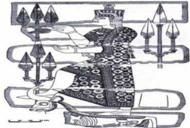
وینە ی ژمارە ٤: خواوەند تەیشەبا (Burney – Lawson 1958: Resim 2)

فەرمان کراوە کە ٤ گا و ٨ مەر بکریتە قوربانی. خودا شیوینی بە ھێماکانی میسماری خواوەندی خۆری ئاشووری شەماش نووسراوە ھەر وەک لە ئاشووردا و گوزارشت لە خۆر دەکات (Piotrovskii 1966: 43).