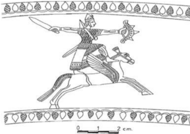
وینە ی ژماره ٨: خواوەند نالائینی (Belli 1998, 59)

باردۆخی ئایینی له سەر دەمی پاشا ئیشپوینی دوای هاتنه سەر تهختی ئورارتو گۆرانگاری زیاتری به خۆیهوه دیت، ئه ویش له ناکاو کاره کتهری خالدی له ئایینی ئورارتودا بووه خواوەندی سهره کی. ئه مهش به لگه ی دهرخه ری گه شه ساندنی ئایینی ئورارتو پهره ی ساندوه. به جۆرێکی تر تا سهر دەمی سهر دوری له نووسراوه کاندای سهر به پاشادا ئاماژه ی ئایینی و ناوی خواوەنده کان نه خراوته پروو. (Payne 2006: 17-20).