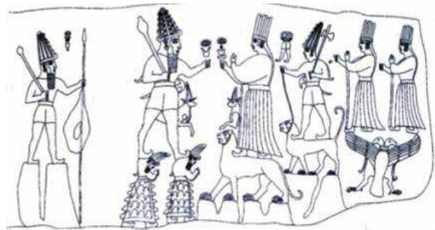
وینە ی ژمارە ٥: خواوەندەکانی شاخ تەیشوپ و ھیبای (Akurgal 2000: Resim 65)

تەیشەبا، کە بە ئایدیۆگرامی خواوەندی زریانی ئاشووری ئەداد لە نووسراوی دەرگای میھر و دەقە میخییەکانی دیکەدا نووسراو (Piotrovskii 1966: 43). ھەر ھە پاشاکانی ئۆرارتویش وەک خواوەندی سەرەکی خۆیان شاریان بۆ تەیشەبا دامەزراندوو. باشترین نمونە ی ئەمەش. شاری تەیشەبا یە کە لە لایەن روسای دووھم دروست کراو (Salvini, 2006: 198). خواوەند تەیشەبا بەزۆری وەک مروفیک وینا کراوە کە لەسەر گایەک وەستاو (وینە ی ژمارە ٤). ئەمەش بەرپیککەوت نییە. ھاوکات گا کە نازە لە پیرۆزە کە ی خواوەندی زریانی خوری و ھیتی تیشوپ، دەگەریتەووە بۆ خواوەندی ئۆرارتو تەیشەبا. ھوسەری تەیشەبا خواوەندی ھوبایە کە ھوتای خواوەندی خورییەکان ھیاتە. (Macqeen 2001: 140-141).