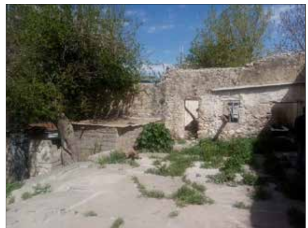
(۵) رووانى دار درخت و گۆگيا لە ناو بىنايەكە - توپزەر

بە ھۆى زۆرى بارانبارىن و نەبوونى رېرەوى رۆشىتنەدەرەوھى ئاوھەكەى، بووھتە ھۆى كۆبوونەوھى ئاوى لە ناو ژوورەكان و حەوشەكەى، ئەوھش ھۆكارى سەرەكەى دزەكەردنى ئاوى بۆ ناو بناغەكەى و زىادبوونى رېژەى شى