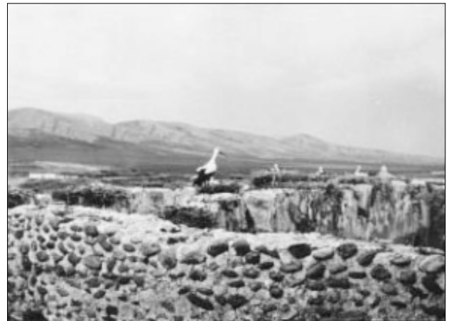
وینه ی (۱)

بینای قشله ی زاخۆ له سه رده می میرنشینی بادیناندا به شییک بووه له قه له مپه وی میرنشینه که، ناوه ندیکی گرنگی کارگیپری بووه تا رووخانی له سه ر دهستی ئیمپراتۆریه تی