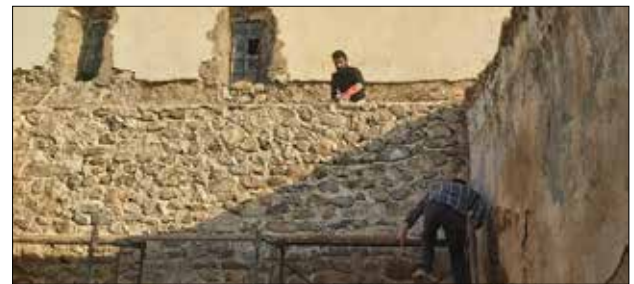
(٥) رووانی دار درهخت و گزوغیا له ناو بیناییه که - توپزه ر

قۆناغی یه که م: بریتی بوو له ئه رشیف و دیکۆمپنت و لیکۆلینه وه و کۆکردنه وهی زانیاری و خاوپنکرده وهی بیناکه له و پووه ک و دارانه ی تێیدا پراوه و لبردنی ئه و پاشماوه ی خوۆ و خاشاک و پسیه ی تێیدا کۆ بووه ته وه، له گه ل لبردنی ئه و زیاده رپۆیه ی کرابووه سه ری وه ک که ره سه ته ی بیناسازیی نوۆی، هه ره ها به هیزکردنی دیواره کان و ئه و به شانیه ی له ناوچوون و دروستکردنه وهی ژووره کانی ژماره (٩-١٠) له گه ل دروستکردنه وهی هه ر (٣) سه رئاوی قوتا بخانه که له شوپنی خوۆی. ئه م قۆناغه به ته واهتی جیه جی نه کراره، ته نیا زیاده رپۆیه کان لابران، له گه ل به هیزکردنی