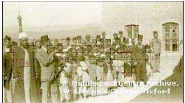
وینە (۲)

قشله‌ی زاخۆ له‌سه‌ره‌تادا بۆ مه‌به‌ستی سه‌ربازی دروست کراوه. بینا سه‌ربازییه‌کان بۆ ده‌سته‌به‌رکردنی ئارامی و ئاسایش و پاراستنی خه‌لکی ده‌ورو به‌ری قه‌لاکان دروست ده‌کران، له هه‌مان کاتدا ناوه‌ندیکی کارگێری و به‌رپۆه‌بردن و خه‌مه‌تگوزارییه‌ش بووه بۆ خه‌لکی شاره‌کان و پێگه‌یه‌کی گرنگی هه‌بووه (عبوش، ۲۰۰۴، ۴۷). قوتابخانه‌ی "ئەحداث" یه‌ش به‌شیک بووه له قشله‌ی