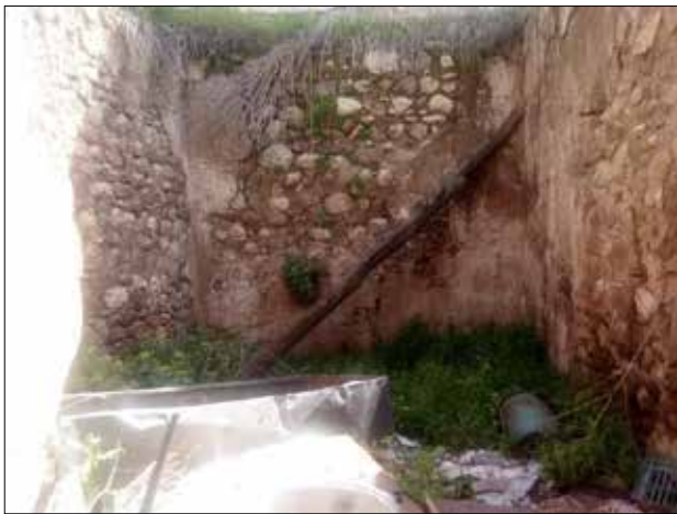
ۋىنەي (۴) پرووانى گۆگيا وچلكن بە ديوارەكان ناوژوورەكە- تويزەر

بارانبارىنى سالانە بە (۵، ۵۳۱، ۵ مەلم) دانراوہ (طە، ۲۰۰۸، ۲۸). رېژەي زۆرى بارانبارىن و پلەي گەرمى دەبىتە ھۆكارى يارمەتيدەر بۆ گەشەکردنى قەوزە و پرووہكەكان لە سەر پرووي كەرەستەكانى بىناسازى و بناغەكەي، بە ھۆي كاريگەريى ئاووھەوا و كارلىكردنى لەگەل تىشكى پروونايى (طە، ۲۰۰۸، ۳۰).