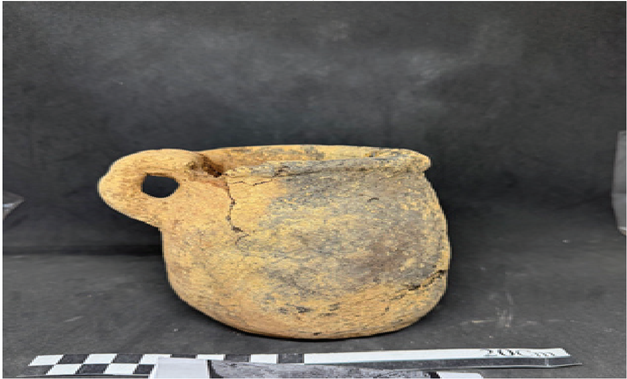
وینەى ژماره(١١) یهکێک له گۆزهکان له گۆری بن په‌ریز