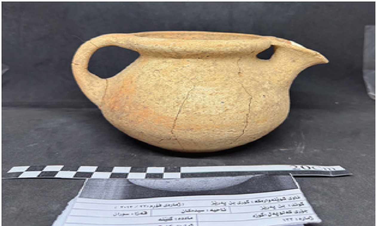
وینەى ژمارە (١٠) یەكێك لە گۆزەكان لە گۆری بن پەریز