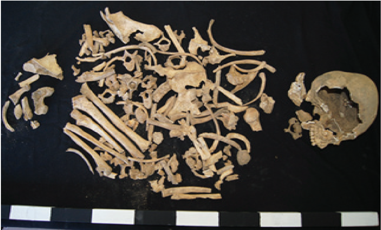
وینەى ژمارە (٥) ئیسک و پروسکەکانى گۆرى بن پەریز