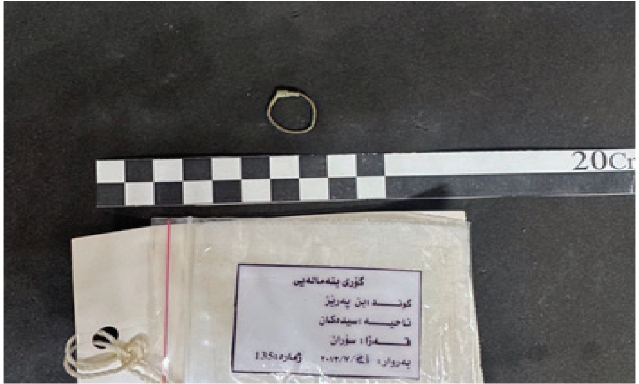
وینەى ژمارە (٧) گوارە یەکیک لە دۆزراوەکانى گۆرى بن پەریز وەک ئامرازى جوانکارى ئافرەتان بەکارهینراوە.