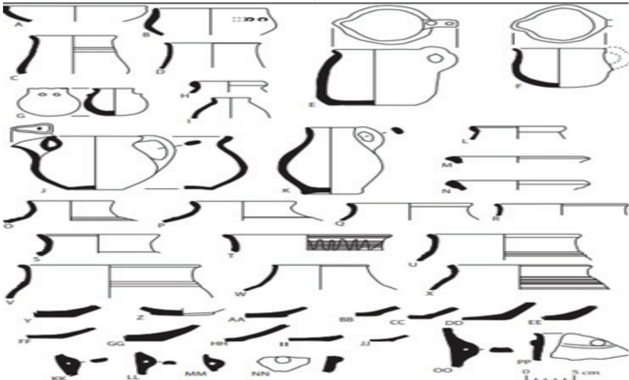
هیلکاری (٢) کلینهکانی گۆری بن پەریز دانتی، ٢٠١٣، لا. ٢٥