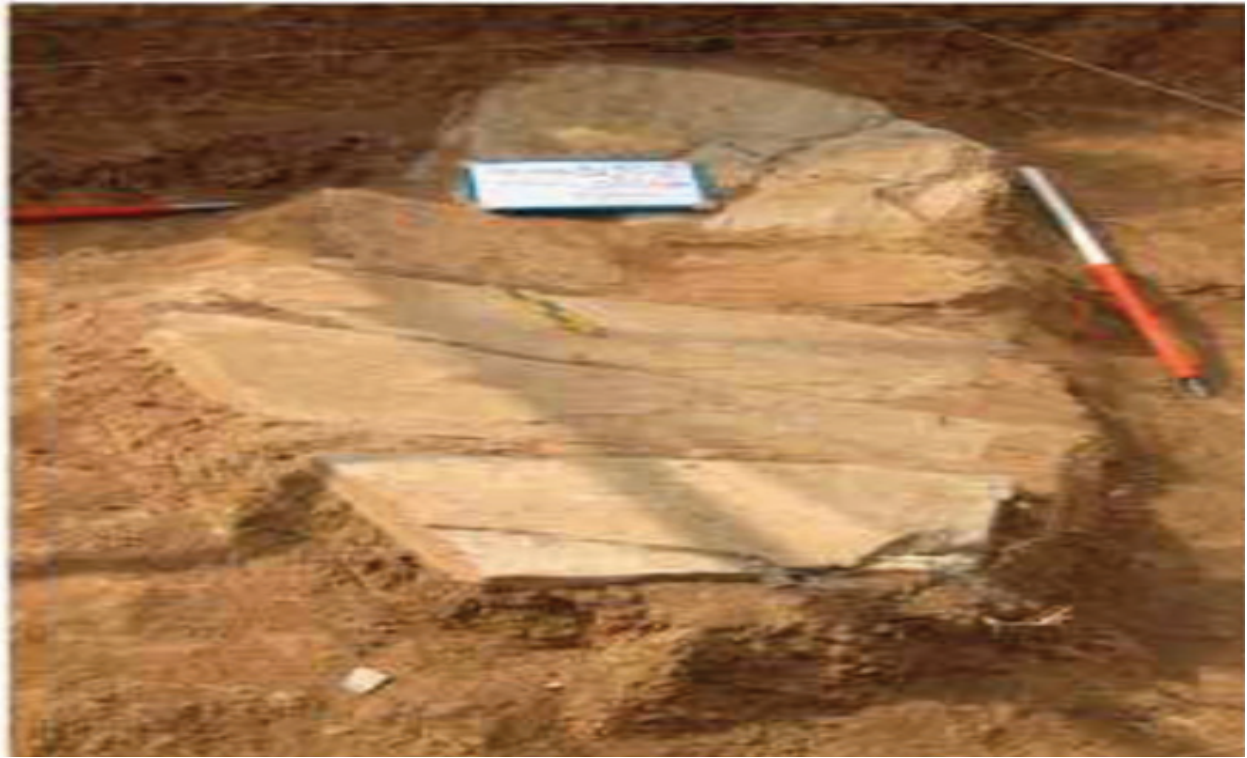
وینەى (٢) گۆرىكى به بەرد داپۆشراو هاوشیوهى گۆرى بن پەریز له ناوچهكانى سنه و حەسنلو (Amelirad, Sheler, Bruno Overlaet, and Ernie Haerincx, ٢٠١١, p٦٤)