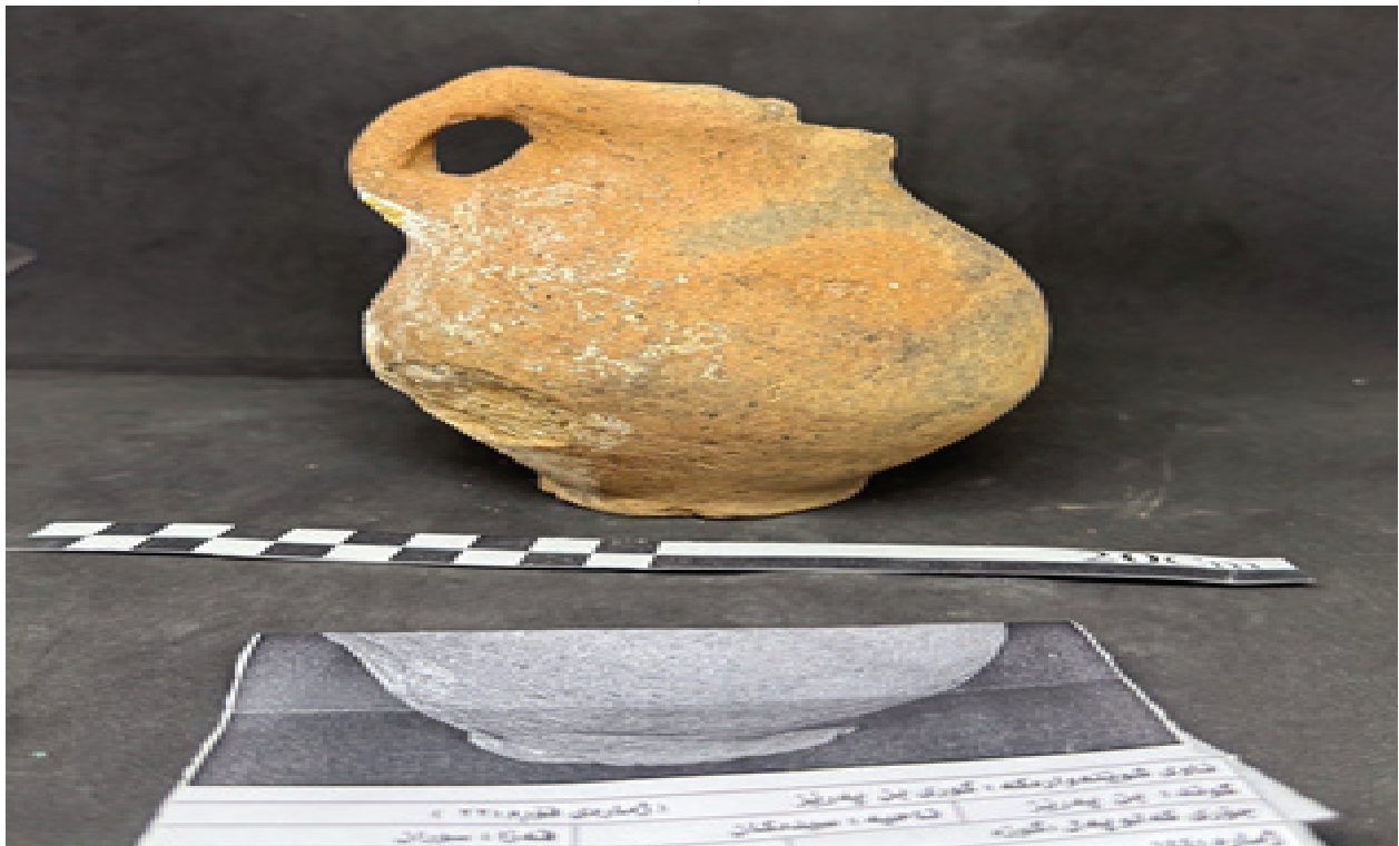
وینەى ژماره(١٢) یهکێک له گۆزهکان له گۆری بن په‌ریز