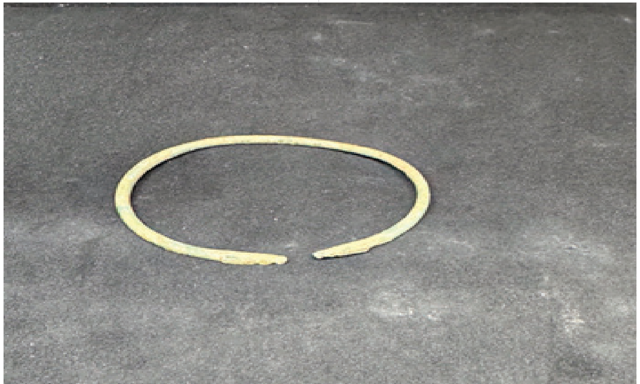
وینەى ژمارە (٨) بازنە/دەستبەند یەکیک لە دۆزراوەکانى گۆرى بن پەریز وەک ئامرازى جوانکارى ئافرەتان بەکارهینراوە. سەرچاوە (تویژەر: ٢٠٢٥/٨/٢٢)