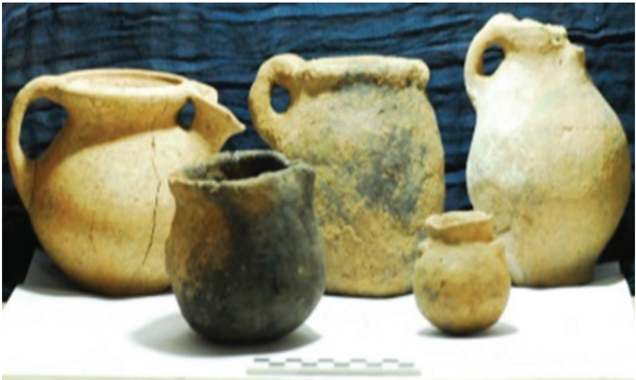
وینەى ژماره (٣) گلینه جۆراو جۆرهكانى گۆرى بن پەریز ئەرشیفى بەرپۆه بەرایهتى شوینەوار و كەلهپوورى سۆران