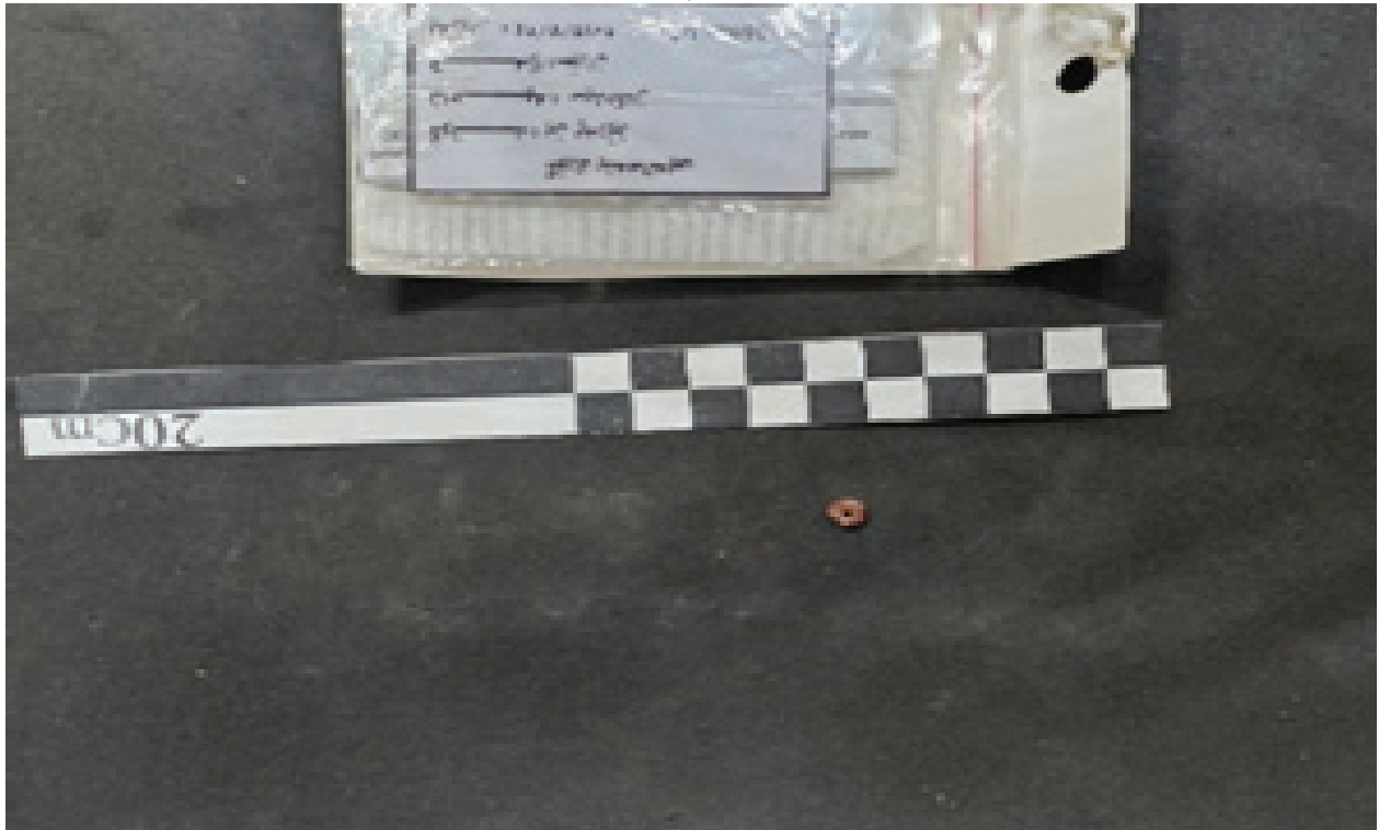
وینەى ژمارە (٩) چەند مۆریکی جوانکاری لە گۆری بن پەریز