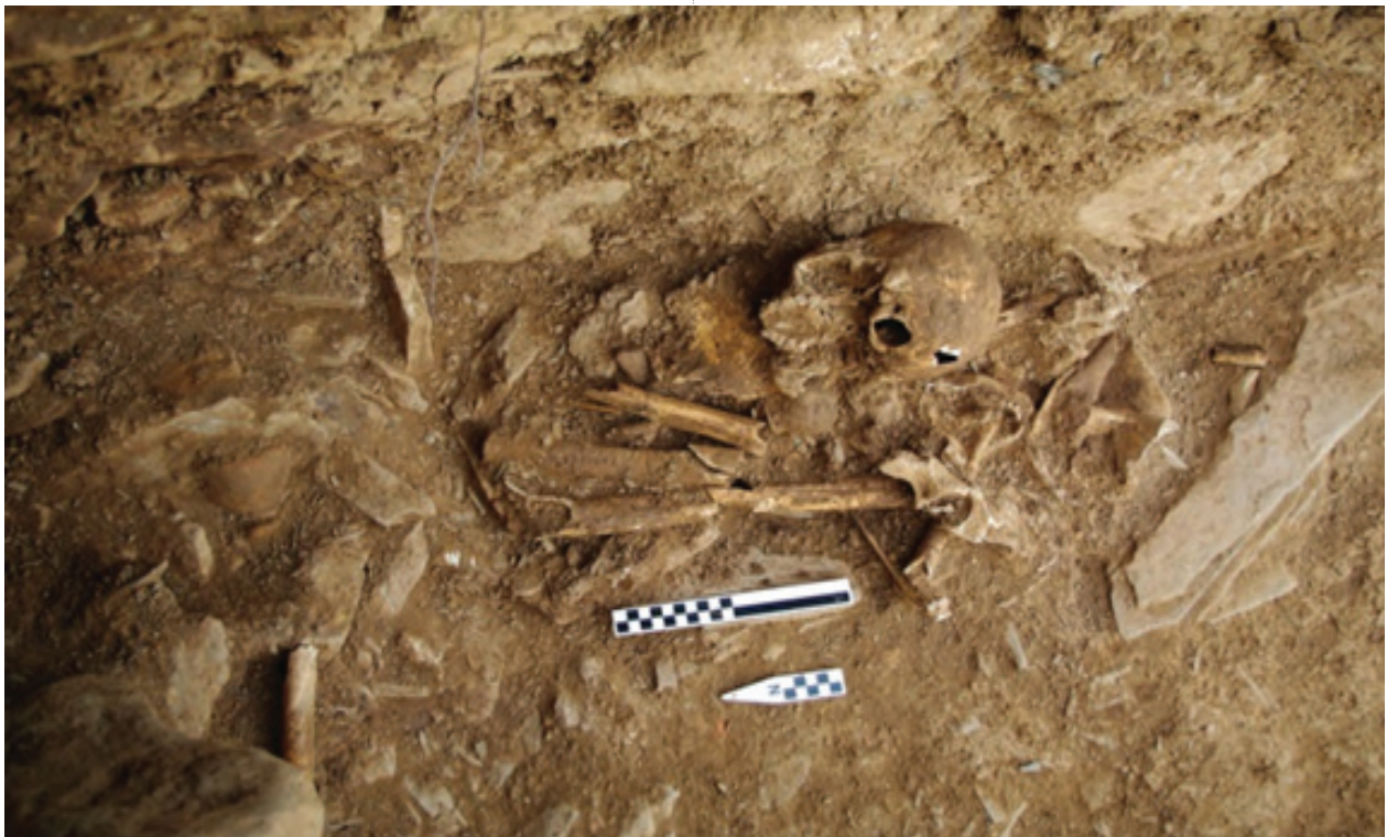
۱۴) ژمارە (۱۴) جىماۋەي ئىسكە پەيكەرەكانى گۆرى بن پەرىز، ئەرشىفى بەرپۆەبەرايەتى شوپنەوار و كەلەپوورى سۆران