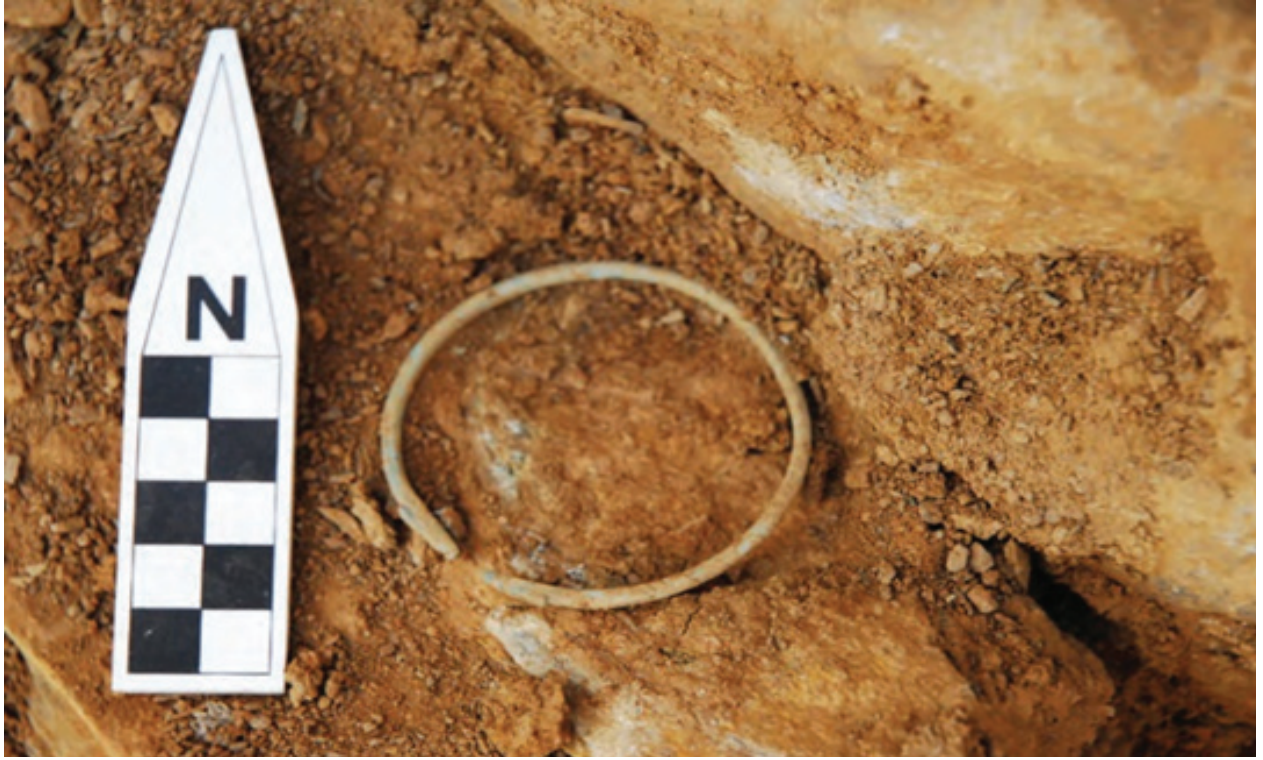
وینهی ژماره (۱۵) دهستبەندی برۆنزی گوندی بن پەریز ئەرشیفی بەرپۆه بەرایهتی شوینەوار و کەله پووری سۆران