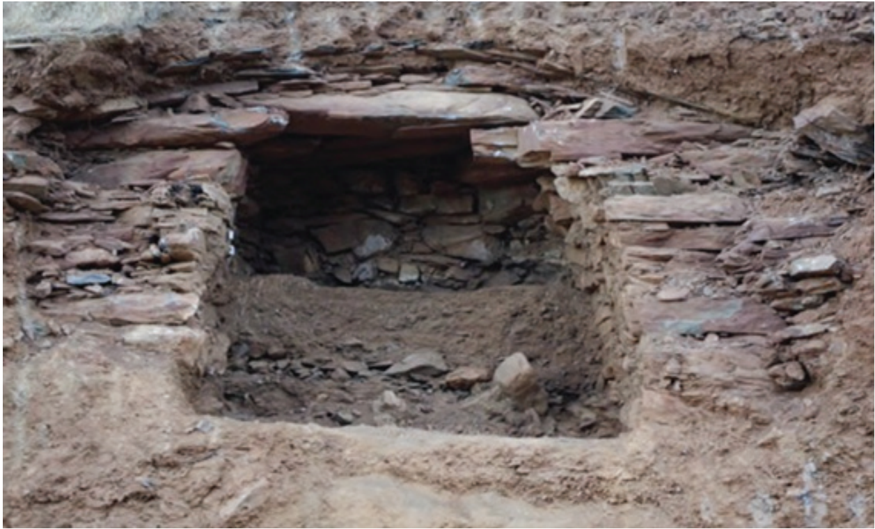
۱) گۆرى بن پەرىز ئەرشىفى بەرىتو بەرايەتى شوپنەوار و كەلەپوورى سۆران