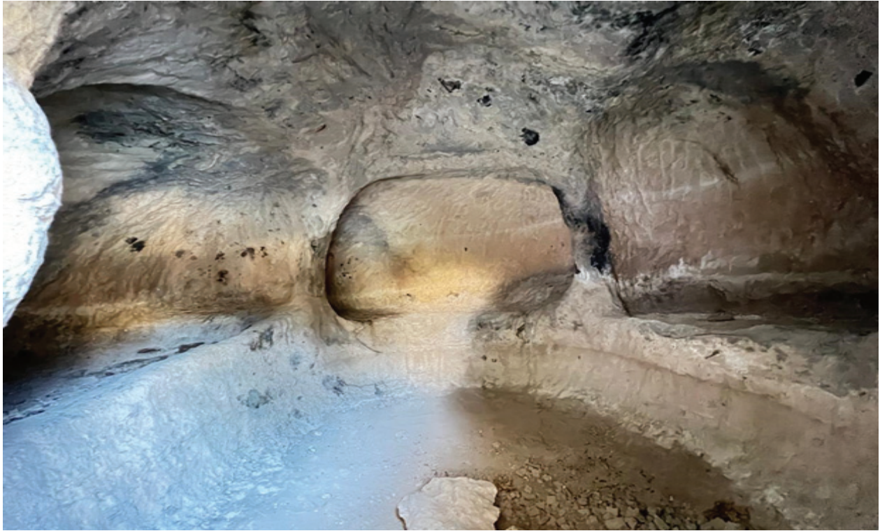
۱۳) گۆرى بەردىنى گوندى پرىسە، ئەرشىفى بەرپۆەبەرايەتى شوپنەوار و كەلەپوورى سۆران.