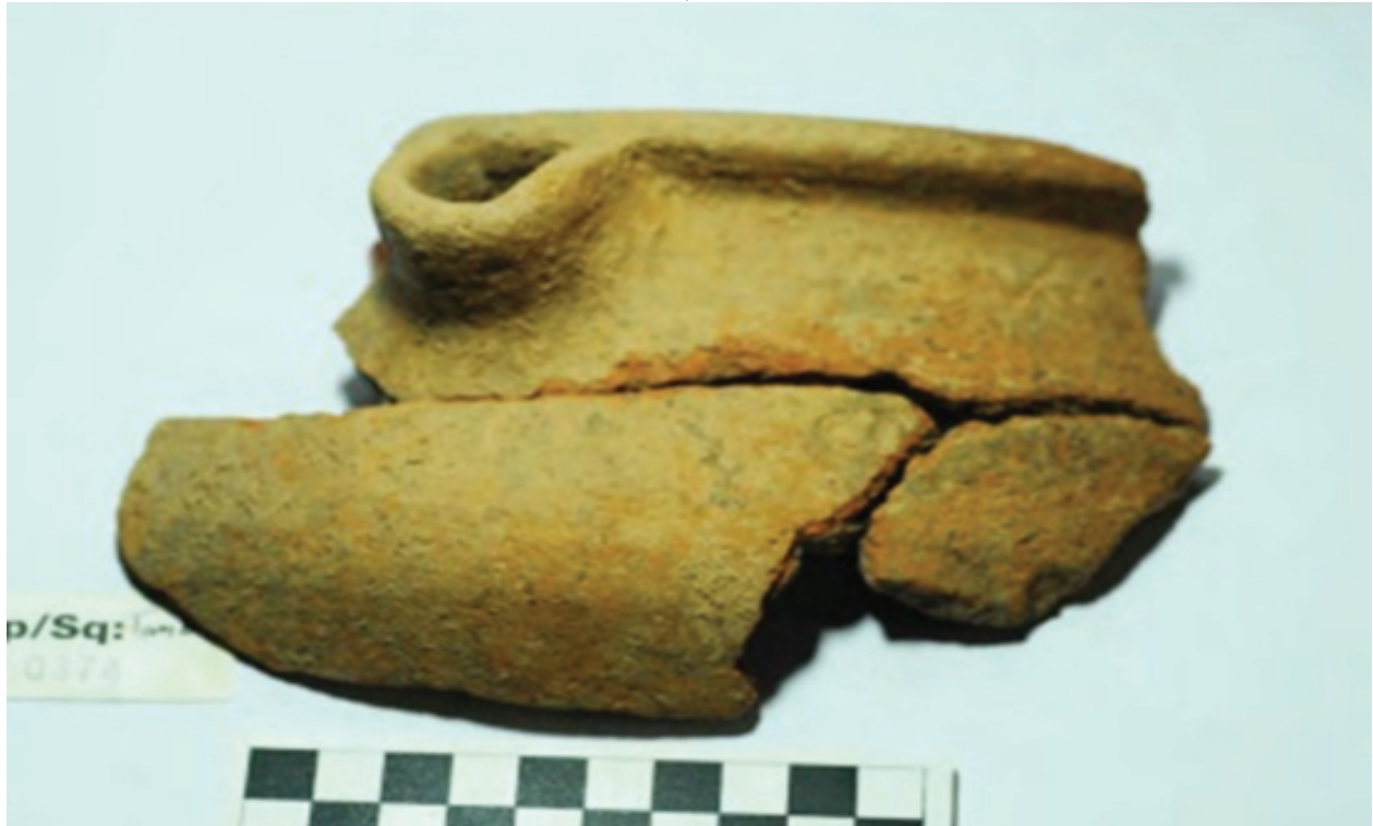
وینەى ژماره (٤)، پارچه دەمى گۆزهیهکی گۆری بن پەریز